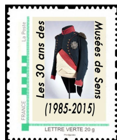
MTAM Habit de chasseur de Napoléon