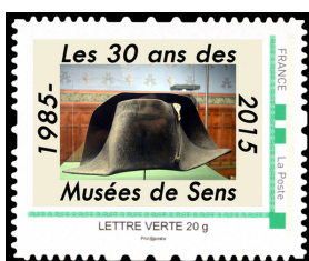
MTAM Chapeau de Napoléon